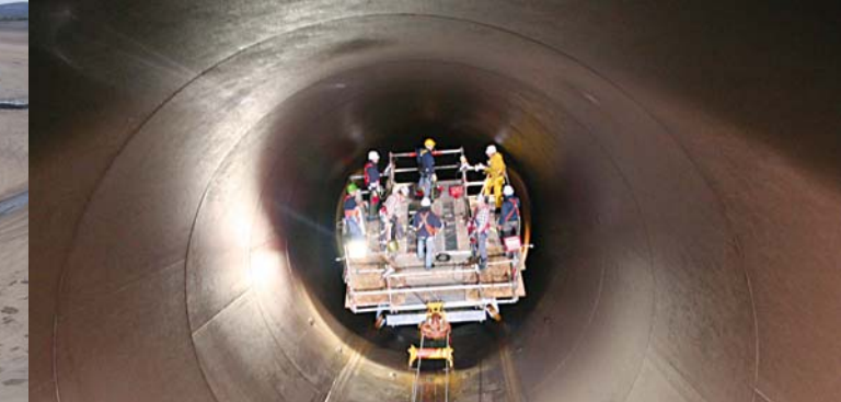
750 m Druckrohrleitung vom Oberbecken bis zur Kaverne.