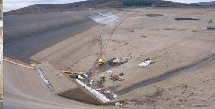
Das Oberbecken fasst 4,4 Mio. m³ Wasser.