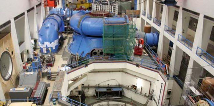
Blick in die Kaverne während der Ausbauphase.