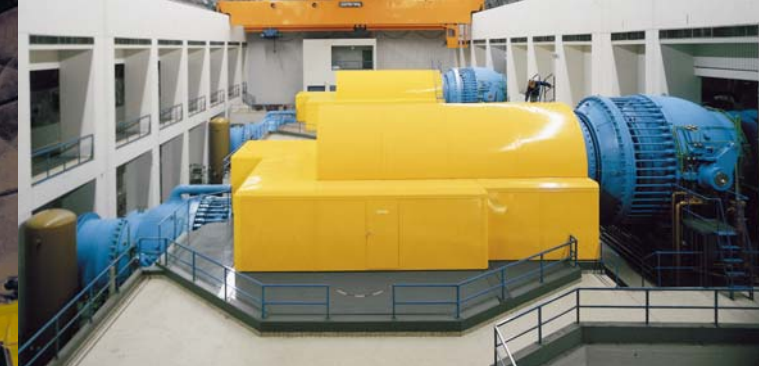
Turbinen in der Kaverne Waldeck II vor der Ertüchtigung.