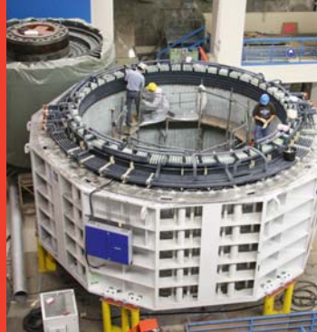
Der neue Generatorständer.